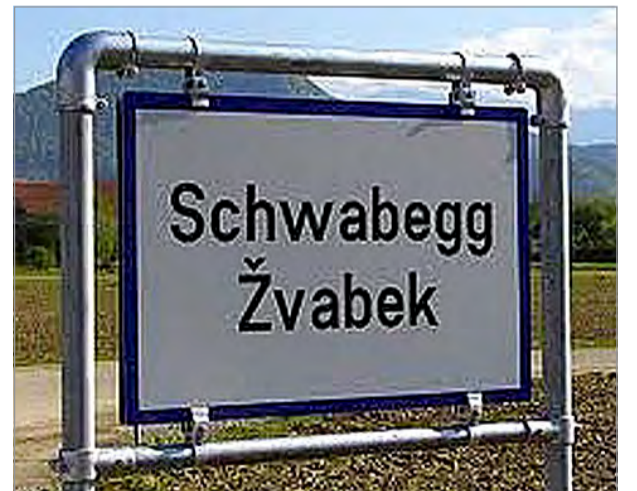
Kaksikieliset tienviitat Itävallassa.

Minuriteettiföreeninkit oon tärkeät ja toimiva minuriteettityön tukena. Kaikila kuuela föreeninkilä oon omat viikkolehet. Itävallalainen raatio ja TV tekkee raatio- ja TV-lähetyksiä heile. Ja minuriteettien puolesta toimii kansa koko maassa yksi föreeninki, jonka tehtävännä oon valvoa majuriteettiväen ja minuriteettien yhteisen olemas-