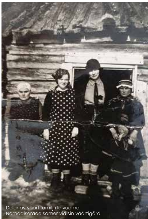
Delar av värtfamilj i Idivuoma. Nomadiserade samer vid sin värtigård.

Tornedalingar, kväner, lantalaiset och samer har levt i samexistens och använt gemensamma marker för försörjning i hundratals år. Minoriteterna har många gemensamma kulturella och historiska nämnare. Lantalaiset och samer har levt i så kallade värtirelationer där nomadiserade samer fått husrum hos lantalaiset vid flytt av renar till säsongsbetonade betesområden. Gamla och sjuka samer fick ibland stanna kvar hos värdfamiljen då den krävande vandringen med renarna kunde innebära försämrat hälsotillstånd. Samiska barn lekte med lantalaisiska barn och det uppstod tycke och giftermål mellan folkgrupperna.