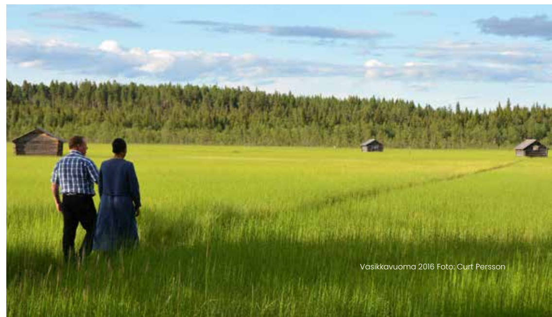
Vasikkavuoma 2016