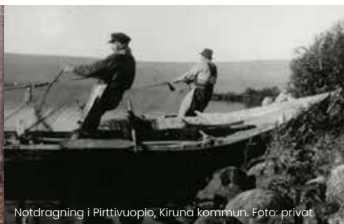
Notdragning i Pirttivuopio, Kiruna kommun.