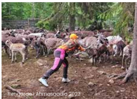
Rengärde i Ahmasaadio 2023

De flesta av näringarna utövas i olika former än idag och har stor kulturell betydelse för minoriteten.